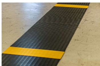
1,50 m schwarz und dann ca. 20 cm gelb